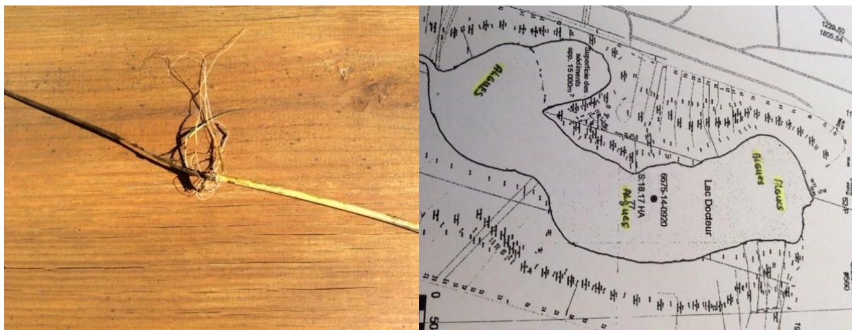
Petites plantes aquatiques à ne pas arracher et les 4 Localisations d'Algues à éviter (5).